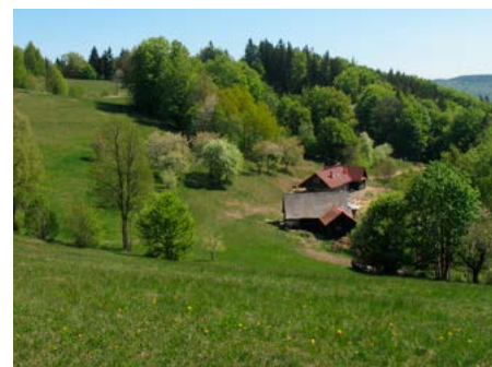
Galovské lúky jsou v Beskydech největší nelesní rezervaci – mají 21 hektarů.

To je jen jeden z příkladů, kdy spolupráce s hospodáři po generace funguje, a bez ní by to ani nešlo. Mnoho lokalit se nám dnes daří udržovat díky financím Programu péče o krajinu nebo evropským projektům „LIFE“.