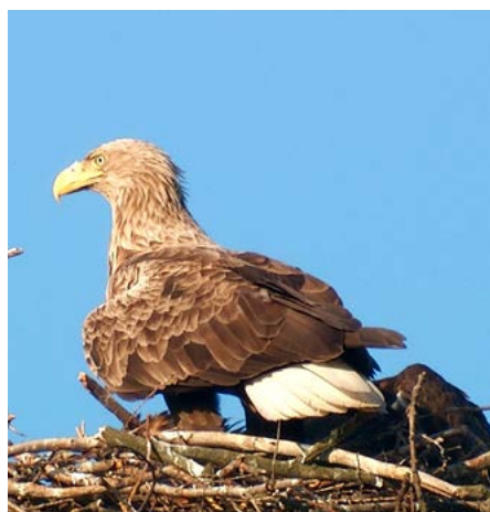
Nebe CHKO Poodří brázdí majestátný orel mořský.

vojem obcí, zástavbou, automobilismem, škodami způsobenými šelmami, usměrňováním těžeb, boje s kůrovcem... Dobře víme, jak velký tlak na ochranu přírody tady je. Dlouhodobě ho ustát, hájené hodnoty udržet a přitom nestát proti všem, je pochopitelně složité. Správě v Rožnově se to ale, aspoň co víme, už roky daří.