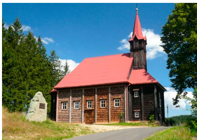
Kraj dřevěných chalup i kostelů – Najdeme je v horách i podhůří, nejen v nejstarším skanzenu u nás. Je to tradice, na kterou mnozí dokáží fortelně navázat.