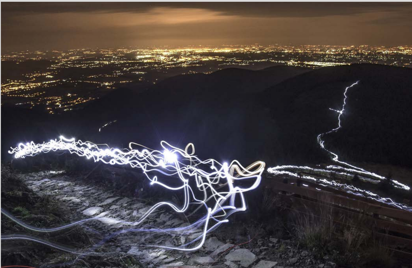
Sportuje – Je to asi největší česká tělocvična pod širým nebem. Počty návštěvníků stále rostou a milovníci horských sportů patří mezi nejpčetnější.