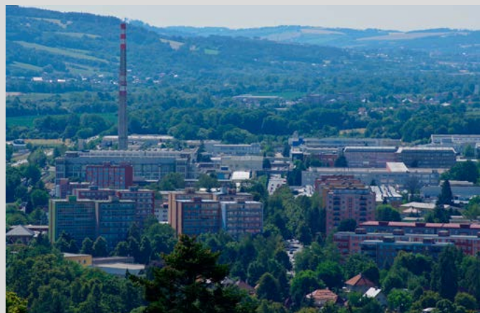
Bydlí i pracuje – Do CHKO patří 67 obcí, působí tu několik stovek firem.