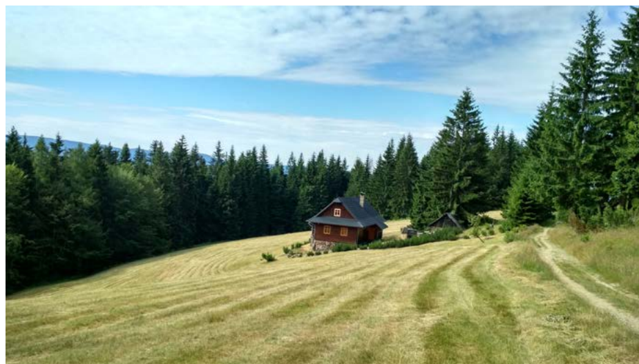
Příklad vhodně zvoleného typu architektury a umístění stavby v krajině.

nost tohoto dokumentu a zvýšit povědomí o jeho možnostech. I přesto jsme si vědomi, že je mnoho potřebných argumentů, které by bylo vhodné do územních plánů dostat. A to nejen pro naši spokojenost, ale hlavně pro naši společnou krajinu. Protože krajina, která je tady kolem nás, by tady minimálně v této podobě mohla zůstat i pro další generace. A to je jedním ze smyslů naší práce.