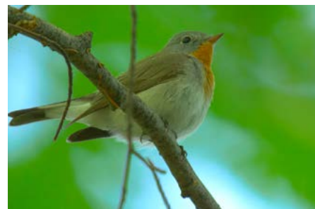
Beskydští ornitologové významně přispěli k poznání života tajemného lejska malého, který v beskydských bučinách tráví jen malou část roku.