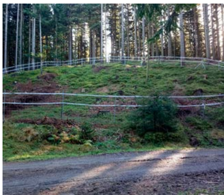
Oplocenka na kovových sloupcích se „zradidly“, která umožňují zejména ptákům vnímat „neviditelné“ pletivo jako překážku.

Lesní porosty tvoří 2/3 celkové rozlohy CHKO Beskydy a pouze 2,5 % z této výměry tvoří národní přírodní rezervace, přírodní rezervace a přírodní památky. Tato území většina lidí správně považuje za prostor, kde mají hlavní slovo přírodní procesy. Jak je na tom ale těch zbylých 97,5 % lesa, který je, ať se nám to líbí nebo nelíbí, především lesem hospodářským? Navíc pouze část lesních porostů v CHKO Beskydy je ve státním vlastnictví, zhruba polovina má majitele církevního, obecního nebo soukromého. Ale na všech těchto majetcích, bez rozdílu vlastnictví, mohou žít vzácní a ohrožení živočichové, kteří v lesním prostředí potřebují převážně „mrtvé dřevo“. Zní to paradoxně, ale tzv. „mrtvé dřevo“ hostí mnoho rostlinných a živočišných druhů, jinými slovy je plné života. Nejde o nic jiného než vidět i v porostech mimo rezervace zlomy, vývraty, souše a narušené stromy, případně větší celky ponechané samovolnému vývoji. A pokud bychom chtěli tento posun za posledních 10 let kvantifikovat, tak na území CHKO Beskydy se ponechává mimo rezervace 810 ha lesa (v rezervacích se jedná