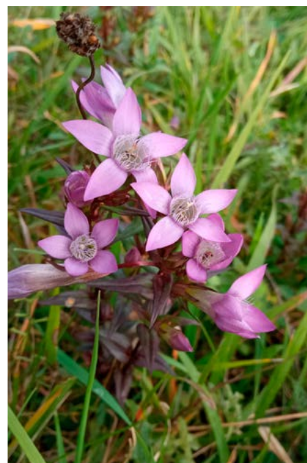
Vzácný hořeček žlutavý najdeme v Beskydech už jen v Huslenkách.

Možná největší díky by zasloužili hospodáři, kteří ve spolupráci se Správou CHKO začali kosit mokřiny, bařiny a močály, a to přesto, že je to plocha hospodářsky neužitečná a podle starých scénářů by zasloužila odvodnit nebo zavézt starým senem. Dnes víme, že mokřady jsou ve zdravé krajině nepostradatelné. Nejen, že zadržují vodu, ale jsou domovem největšího počtu dnes chráněných rostlin, měkkýšů, obojživelníků... V Beskydech hostí například víc než třetinu všech kriticky a silně ohrožených druhů rostlin (!). S hospodáři i nadšenci udržuje Správa asi tři desítky mokřadů na zhruba dvaceti hektarech po celé chráněné krajině oblasti. ■