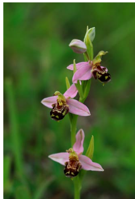
CHKO Bílé Karpaty se pyšní velkým počtem orchidů. Mezi ně patří například tořič.

A podobně jako s Beskydami se to má i s našimi kolegy. Taky nás občas překvapí a jsme si blízcí, i když jsou vzdálení. Jsou to opravdoví přátelé, se kterými jsme toho už dost prožili, karpatský oblouk nás spojuje pevně. Proto jim přeji, ať je v té úžasné krajině stále dost místa pro přírodu i pro dobré lidi, kteří v horách žijí nebo je jen navštěvují. ■