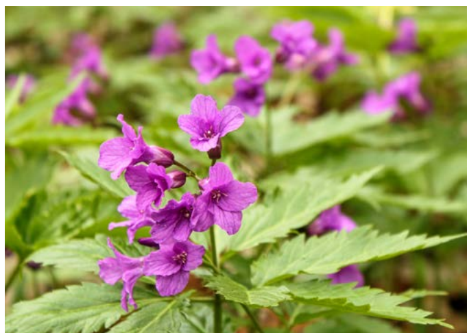
Kraj rostlin a zvířat z východu – Beskydy sice nemají svůj endemit, ale řada druhů zde má západní hranici svého rozšíření. Kyčelnice žláznatá, karpatský čolek či slimák zvaný modranka jsou zde doma.