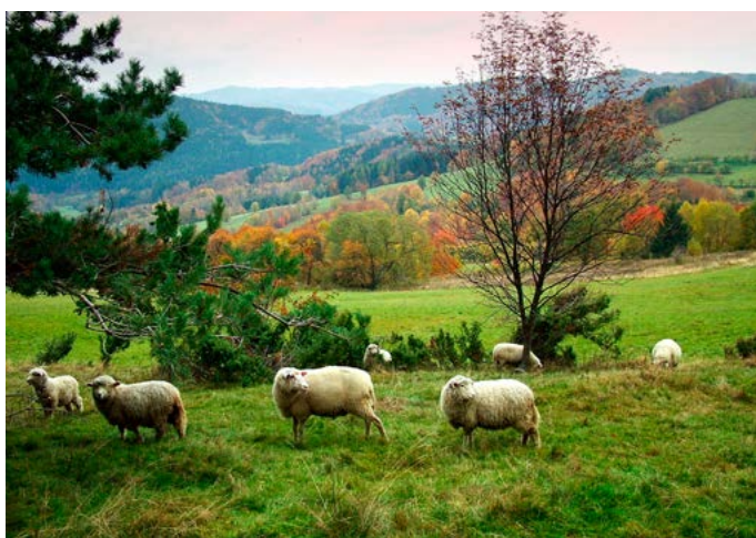
Kraj ovcí a jalovců – Bez ovcí (a dávných valachů, kteří sem s nimi přišli) by Beskydy nikdy nebyly Beskydami.