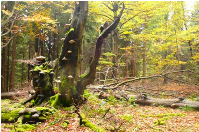
Kraj karpatských pralesů – Staré, přírodě blízké jedlobukové lesy jsou opravdovým královstvím divočiny a jejich královnami jsou majestátné jedle.

...ale rozhodně nejde o okrajovou záležitost, vždyť je to: