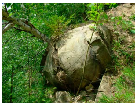
V dnes již opuštěném lomu ve Vidči se nacházejí kulovitá a bochníková pískovcová tělesa. Tyto „kamenné koule“ jsou staré asi 60 miliónů let.

Beskydský pseudokras (puklinové a rozsedlinové jeskyně) patří v kategorii pískovců k největším na světě. V oblasti Moravskoslezských Beskyd a Javorníků objevila a zdokumentovala za 50 let existence CHKO speleologická společnost Orcus z Bohumína 45 jeskyní. V roce 2022 byla digitálně