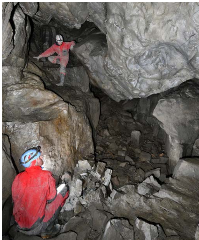
Kraj strmých hor a neobvyklých jeskyní – Zdánlivě nudný pískovec dokáže vytvořit neuvěřitelně členitý terén, kde nechybí ani pseudokrasové jevy.