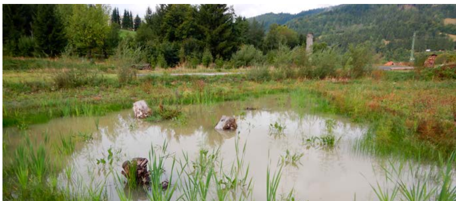
Obnova mokřadu v Karolině byla společnou myšlenkou zástupců města a pracovníka Správy CHKO Beskydy.

Obce a správci lesů se pustili i do zlepšování zadržování vody v krajině a vytváření tůň či rekonstrukce vodní nádrže jako důležitých míst pro rozmnožování obojživelníků a existenci na vodu vázaných druhů. Pečovalo se i o cenné beskydské bezlesí a velkou výzvou bylo i zlepšení zabezpečení hospodářských zvířat před útoky velkých šelem, zejména vlků. Je dobře, že Beskydy jsou plné akčních lidí s nápady ve prospěch přírody a Správa CHKO ráda ty nejlepší podporuje. ■