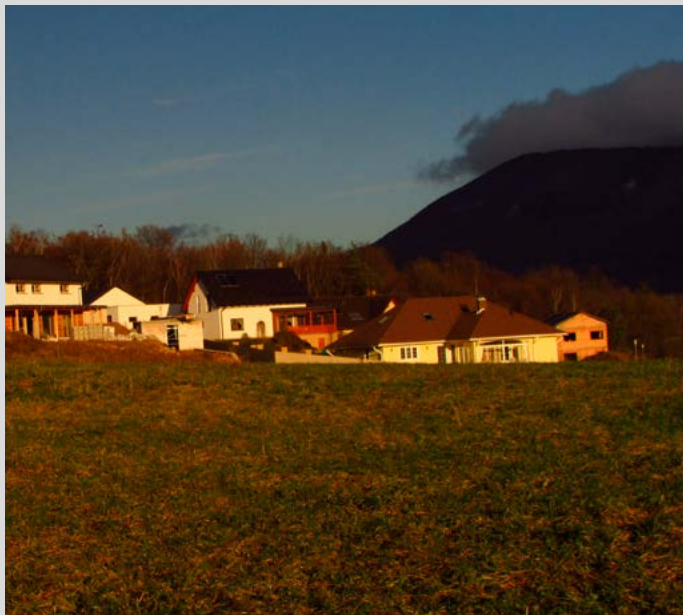
Staví – Snad v žádné jiné CHKO u nás nepanuje takový stavební ruch!