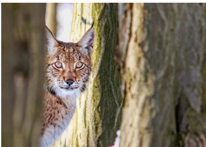
Kraj velkých šelem – Tak jako jinde v nekonečných horách Karpat je zde doma nejen rys a vlk, ale i medvěd či kočka divoká.